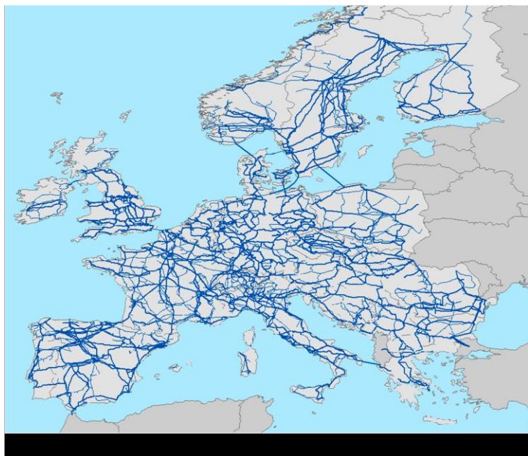
Figura 1. Representación esquemática de la red de líneas de transporte (220-999 kV) en la Europa Unión. La figura destaca la intensidad con la que esta área está interconectada a través de líneas de transporte

“Normalmente, estos apoyos se colocan a una distancia de unos 200-400 metros entre sí y con un base de 10 por 10 m (100 m 2 ) en promedio. Hoy en día, Europa tiene red de transmisión de casi 500.000 kilómetros aproximadamente de líneas aéreas y Estados Unidos alrededor de 254.000 kms, lo que significa 2,5 millones y 1,27 millones de apoyos, respectivamente. Consecuentemente, tenemos una gran superficie bajo las torres que podemos utilizar potencialmente para conectar poblaciones de especies con una capacidad de dispersión limitada en paisajes fragmentados”, concluye Miguel Ferrer.